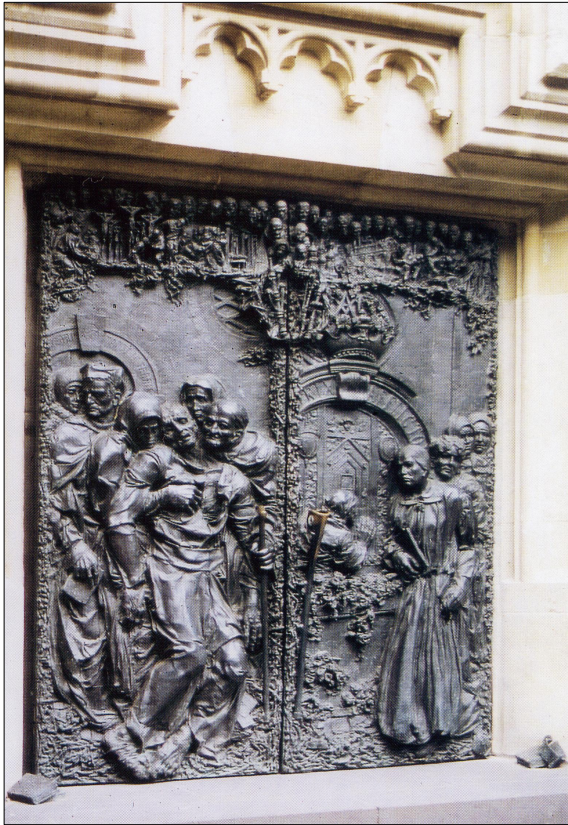
„Portal der Nachfolge“ von Bert Gerresheim an der Südseite der Basilika in Kevelaer